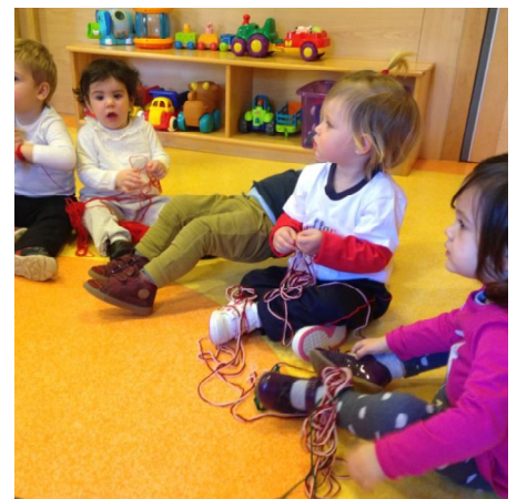
Suport a les Escoletes

Es tracta, per tant, de polítiques socials lligades a l'educació de la primera infància. Un front que lidera la insitució insular quant a la fixació d'uns criteris homogenis amb els ajuntaments. Per altra banda, es destinen més recursos al sosteniment de les escoletes infantils i s'han establert beques per a les famílies amb infants petits que tenen dificultats per a l'escolarització d'aquesta etapa.