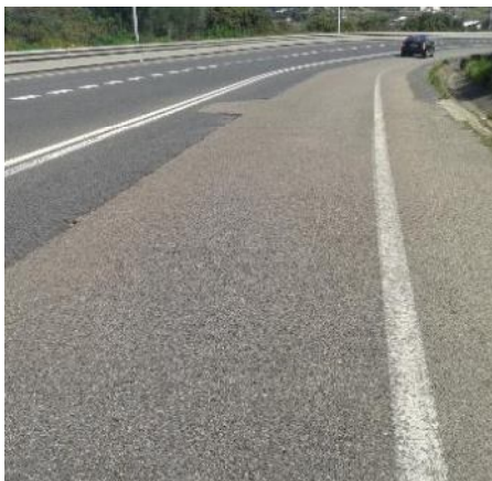
Costa del port de Maó

El Departament de Carreteres i Camins no tan sols s'ha centrat en la via principal de Menorca, sinó que també ha actuat amb celeritat per resoldre els inconvenients que representaven algunes vies secundàries. A Maó, s'ha actuat a "Cases de s'Ateneu", actualitzant un projecte de 2010 i s'ha executat el tram de baixada al port de Máo. També es redactarà el projecte per a la carretera entre es Mercadal i es Migjorn i s'han encarregat les redaccions de projectes per reforçar el paviment d'altres 5 carreteres més. També s'ha fet una anàlisi de la resta vials competència del Consell.