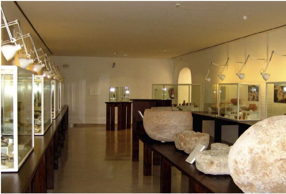
Una passa important en la política museística de Menorca