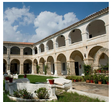
Llatzaret de Maó

Quant a les Coves de Cala Blanca, i pendent dels tràmits municipals, l'impuls del Consell és aconseguir els informes preceptius per obrir-les. Pretén, a través del Govern balear, recuperar el finançament que el PP va deixar perdre. Les coves han de ser un nou referent per als menorquins i visitants.