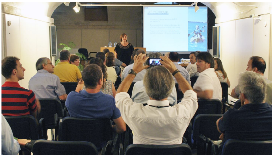
Trobada, el propassat 26, per a la constitució del nou ens

En un any, el Govern de canvi al Consell ha aconseguit reactivar i constituir del tot l'organisme públic que vetlla, promou i informa del turisme a la nostra illa. Després dels coneguts retards per fusionar el Fomento del Turismo [d'iniciativa privada] i Fundació Destí , adscrita al Consell, la fusió d'ambdues entitats és una realitat des de l'octubre de de l'any passat, amb el nou nom de Fundació Foment del Turisme de Menorca . Des de llavors, la nova entitat que agrupa la iniciativa privada i la representació pública, treballa en una única direcció. Tanmateix, la Fundació del Foment del Turisme es va completar el passat dia 26 de juliol amb la constitució de l'Assemblea, que acull la representació dels