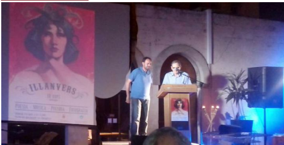
El Festival reneix amb nous conceptes