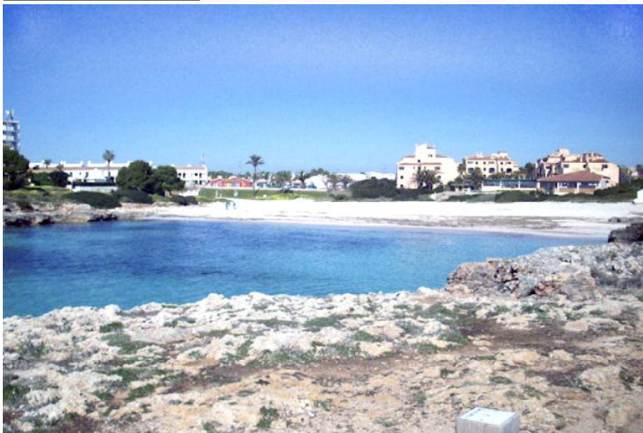
Platja de Cala en Bosc, una de les tres que restà tancada al bany durant uns dies