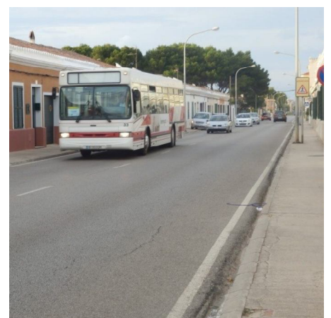
Millora de la infraestructura viària

S'executarà en dues fases que són una nova pavimentació amb calçada, voreres, la reordenació del tràfic (que serà de sentit únic), la millora de l'enllumenat amb tecnologia led i la millora de les infraestructures. També, està previst que el projecte resolgui el problema d'aigües pluvials que afecta des de fa anys amb inundacions a les cases d'aquesta carrer/carretera.