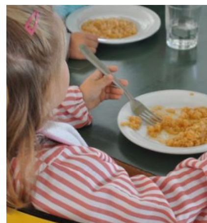
Infants coberts per les beques

aquest, i per l'altra, garantir la cobertura de les necessitats d'alimentació durant l'estiu, un cop finalitzat el període lectiu, a les famílies més necessitades. Tot plegat ha estat una feina coordinada amb els Serveis Socials de l'Ajuntament i els respectius centres educatius, juntament amb el Consell Insular de Menorca. La bona gestió ha fet possible arribar a moltes famílies.