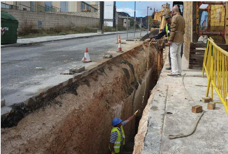
Un calendari d'actuacions obliga a ajuntaments i promotors a complir amb la Llei