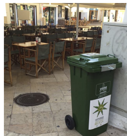
Contenedor petit per a l'establiment

Entre juny i juliol la recollida va ser de més de 23 tones, el que indica que la iniciativa és molt positiva. Així, el municipi amb més pes turístic de l'illa aposta per un reciclatge responsable. De fet, les Illes són capdavanteres en reciclatge a l'Estat espanyol.