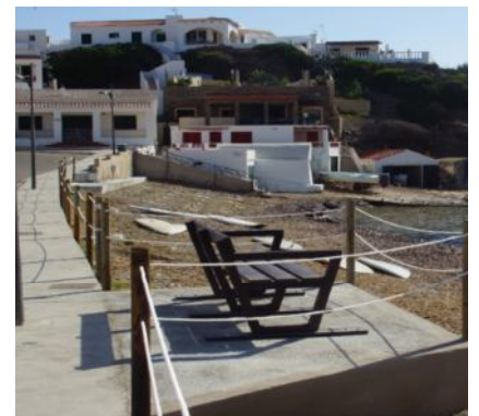
Espai habilitat per a 7 embarcacions