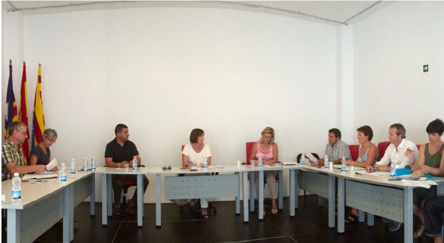
Junta de batles. Reunió on es va començar a parlar dels projectes de l'ecotaxa

Les coves de Cala Blanca, el manteniment del Camí de Cavalls i la catalogació d'altres camins públics de l'illa, el patrimoni talaiòtic o projectes relacionats amb l'aprofitament de recursos hídrics són les principals propostes que presenta el Consell de Menorca perquè siguin finançats pels recursos obtinguts de l'Impost de Turisme Sostenible [ITS].