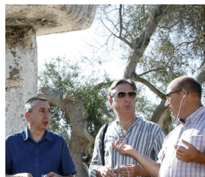
Explicació als mitjans