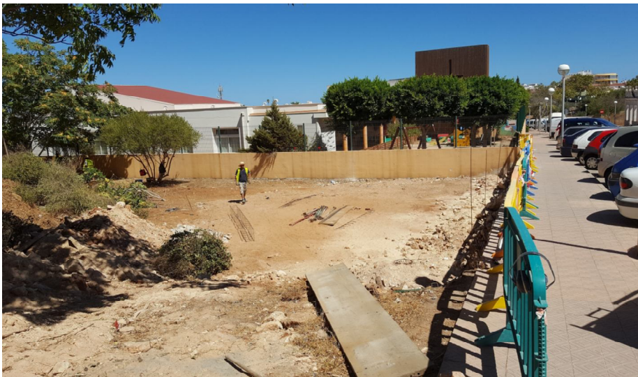
Els infants disposaran de molt més espai per a l'activitat lúdica