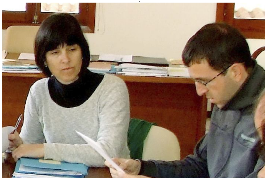
Platja de Cala en Bosc, una de les tres que restà tancada al bany durant uns dies

Una de les significatives millores serà el disseny de voravies més amples i la delimi-