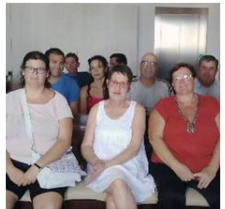
Els contractats d'aquest programa

La iniciativa ha comptat amb la participació del Servei d'Ocupació de les Illes Balears (SOIB) , del Servei Públic d'Ocupació Estatal (SEPE) i el Fons Social Europeu (FSE) .