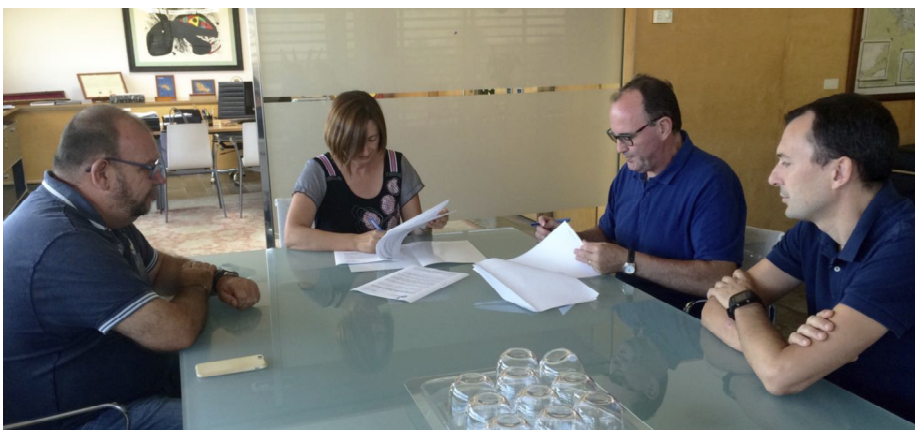
La presidenta Salord, el mes passat, a la signatura de l'acord amb la premsa local